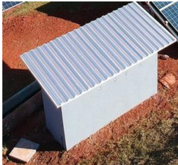
Figura 12: Casa de máquinas na usina solar (imagem ilustrativa)

Casa de máquinas é o compartimento onde são colocados os componentes que promovem a transformação de corrente contínua (CC) em corrente alternada (CA), injeção na rede da concessionária (ENERGISA), bem como as proteções do sistema, os principais equipamentos nesta casa de máquinas são: inversor, stringbox, transformador e sistema de proteção. A casa de máquinas deve ser próxima de a usina solar, e deverá ter aproximadamente as seguintes medidas 1,80x2,50x2,00m (LxCxA). Vale ressaltar que no acabamento deverá no mínimo ter contrapiso e ser rebocado por dentro e fora da casa de máquinas. Segue abaixo imagem ilustrativa de como deverá ser instalado a casa próximo a usina.