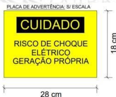
Figura 12: Placa de advertencia (imagem ilustrativa)

Será instalada uma placa de advertência, confeccionada em aço inoxidável ou alumínio anodizado, sendo afixada de forma permanente sobre a caixa de medição/proteção no padrão de entrada, com os seguintes dizeres: “CUIDADO: RISCO DE CHOQUE ELÉTRICO – GERAÇÃO PRÓPRIA”, com gravação indelével, conforme foto abaixo: