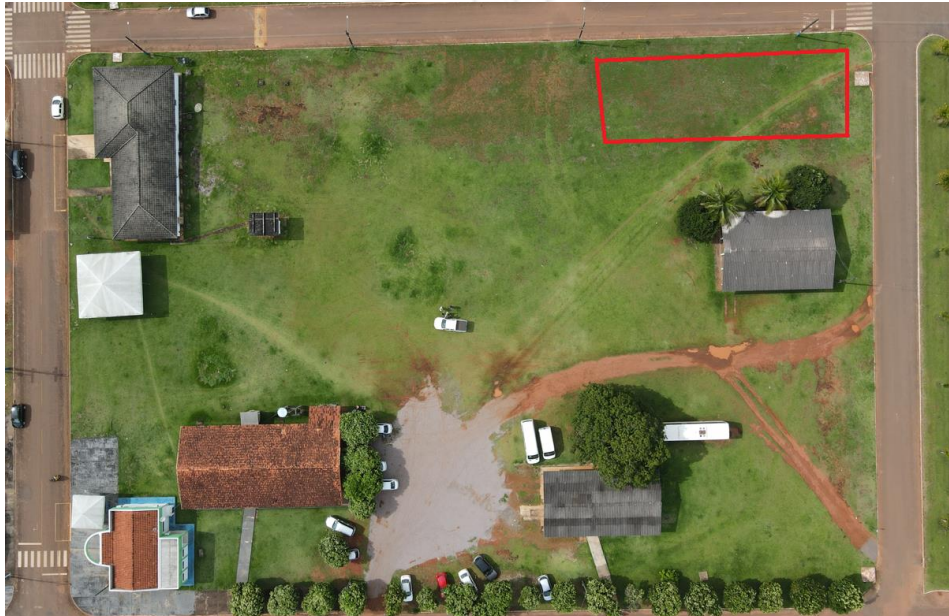
Figura 01: Planta de Situação

O Presente memorial descreve as diretrizes básicas e mínimas que devem ser observadas na execução da obra de implantação de Geração Distribuída ao Sistema de Distribuição Secundário de Energia Elétrica da Concessionária ENERGISA/MT, por meio de microgeração distribuída através da conversão solar fotovoltaica para atender as necessidades de consumo da Prefeitura Municipal de Itaúba/MT, observando as condições gerais de projeto especificação de materiais qualificação técnica mínima, localização da obra, material que deverá ser utilizado, informações para execução da obra, registro junto ao CREA/MT, aprovação junto a ENERGISA, memorial descritivo e segurança a terceiros.